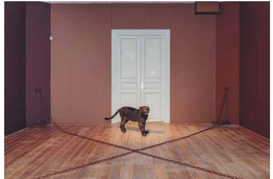
Hesselholdt & Mejlvang, bild från utställningen på konstmuseet.

I en omfattande installation närmar sig Hesselholdt & Mejlvang frågor om hur vi gärna vill förstå människor utifrån yttre parametrar såsom utseende, etnicitet, religion och kulturella uttryck. Konstnärerna har utgått från hudläkaren Thomas B. Fitzpatrick skala av olika hudtyper. Genom sex färgnyanser leds besökaren på en kulturhistorisk och populärkulturell vandring. Utställningen är en kritisk kommentar till eurocentrism, allmänna normer, fördomar och klichéer, och försöker skapa fördjupade och reflekterande perspektiv på etniska kategoriseringar i vårt samhälle.