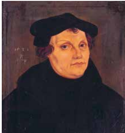
Lucas Cranach d.ä. 1472–1553, Martin Luther , olja på pannå. Uppsala universitets konstsamlingar: Beskuren.

Kulturlov: Skogen, fjällen och havet – hängande skulptur