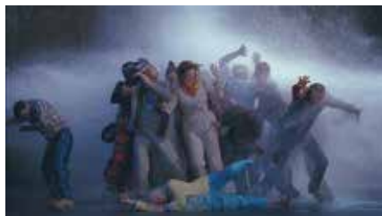
Bill Viola, Tempest (Study for The Raft) , 2005. Color high-definition video on LCD flat panel mounted on wall.

Vernissage: Bill Viola Visitation – Reformation i Uppsala domkyrka. 15.00–16.45 Visning och mingel på Uppsala konstmuseum.