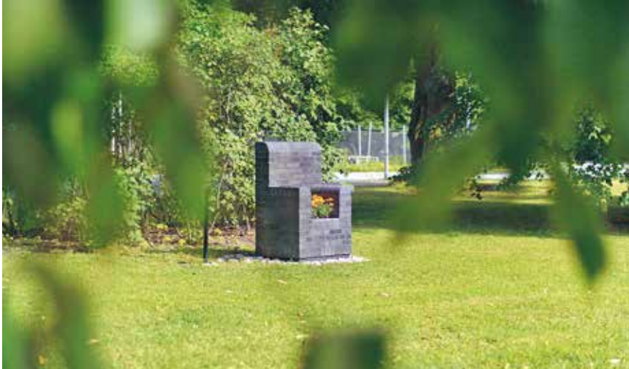
Poetisk viloplats av Ulla Viotti.

Under ett antal onsdagar visar Uppsala kommuns intendent för offentlig konst en serie konstverk i staden längs stråk eller som enskilda verk. Alla visningar är kostnadsfria.