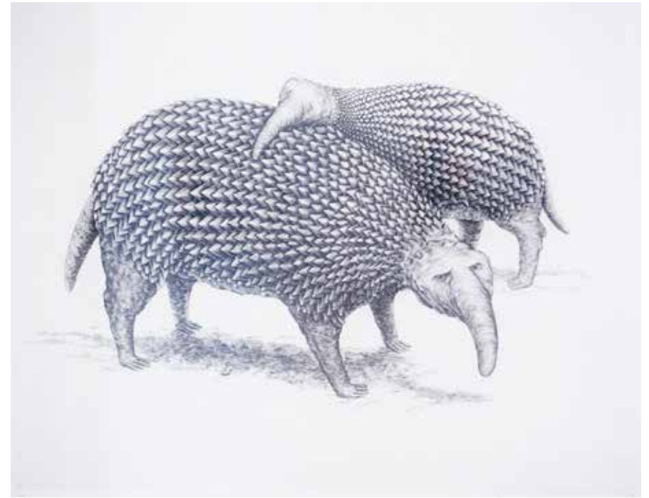
Ulla Fries, Snabeldjur , kopparstick, 1997.

50 år tillsammans 20 maj – 8 oktober 2017