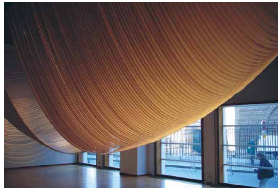
Kaarina Kaikkonen, My Outline , Paris, 2001.

My Outline 23 september 2017 – 7 januari 2018