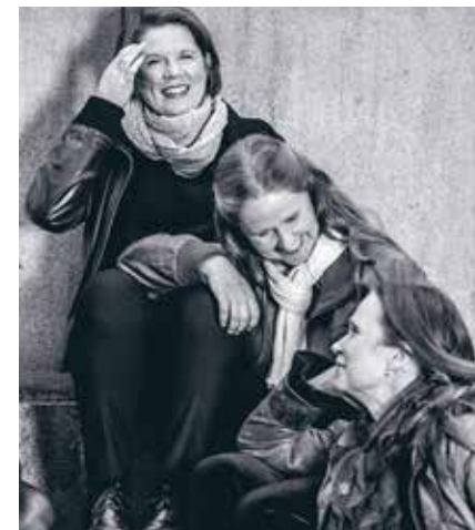
Stråktion Ensemble Fenix.

MUSEET OCH CAFÉET HAR KVÄLLSÖPPET torsdagar 12.00–20.00