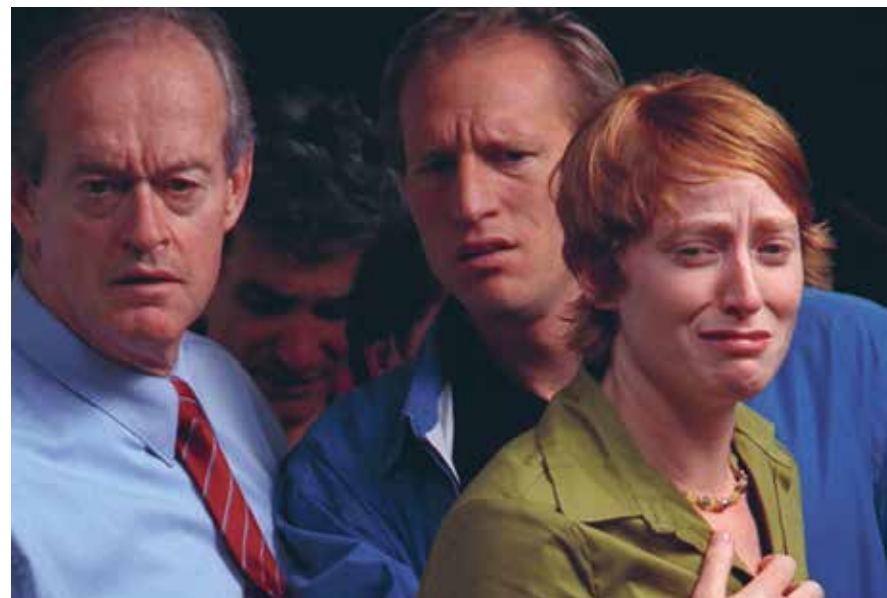
Bill Viola, Observance, 2002. Stillbild ur video, beskuren. 10:14 minuter.

I videoverket Observance från 2002 panoreras människor i närbild i en avskalad ritual. Ansiktena har eftertänksamma och starka uttryck. Ålder, klädstil och utseenden skiljer sig åt. Konstnären Bill Viola är internationellt uppmärksammad som pionjär inom videokonsten och för sina laddade videoinstallationer i kyrkorum. Verket är en del av den större utställningen Visitation Reformation i Uppsala domkyrka. 2017 uppmärksammar Svenska kyrkan att det är femhundra år sedan den tyske teologen Martin Luther presenterade sina berömda nittiofem teser och att den protestantiska reformationen inleddes. För att lyfta fram samspelet med den äldre konsten visas på Uppsala konstmuseum ett urval målningar ur Uppsala universitets konstsamling i samma rum tillsammans med videoverket Observance .