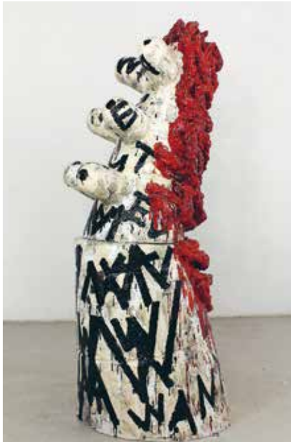
Veronica Brovall, Eating You Alive , glaserad keramik, 2013.

Veronica Brovalls estetik är uttrycksfull och direkt i en sorts punkig expressionism. Liksom gatans graffiti använder konstnären ibland också ord och bokstäver som både budskap och bildelement i sina skulpturer. Brovall använder också vardagliga föremål som hon giuter av och för in i konstverket.