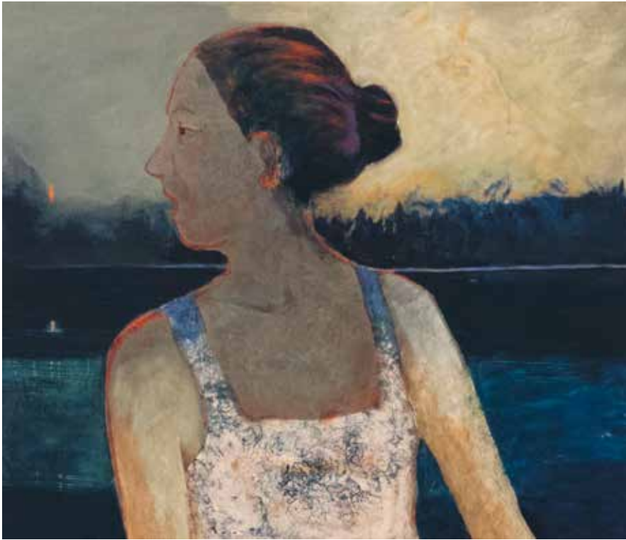
Gudrun Westerlund, Det kommer det som saknas , äggoljetempera på duk, 2017. Beskuren bild.